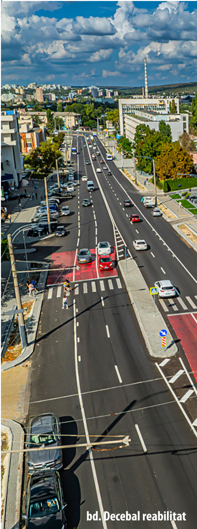
bd. Decebal reabilitat