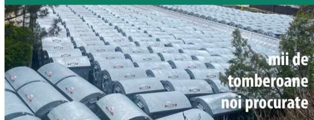
mii de tomberoane noi procurate

Proiectul „Deșeuri Solide Chișinău”, finanțat de către Primăria Chișinău și investitorii internaționali.