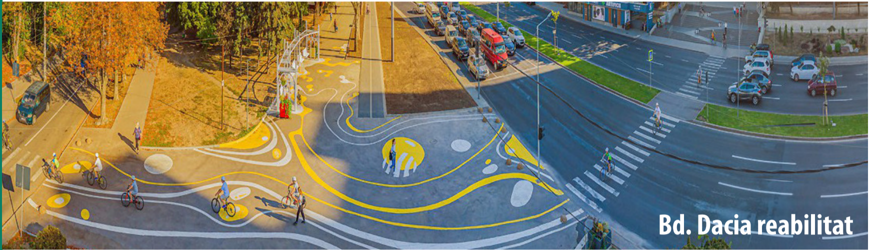
Bd. Dacia reabilitat

Munca unei echipe se vede prin rezultatele obținute. Echipa Partidului Mișcarea Alternativa Națională este formată din profesioniști care se dedică, se implică, se bucură de colaborări atât pe intern, cât și pe extern. Este echipa căreia îi pasă de viitorul fiecărui cetățean. Datorită acestei echipe și cu implicarea locuitorilor capitalei, au fost implementate mii de proiecte, iar Chișinău a redevenit o capitală culturală, educațională, sportivă și turistică. Împreună am demonstrat că se poate!