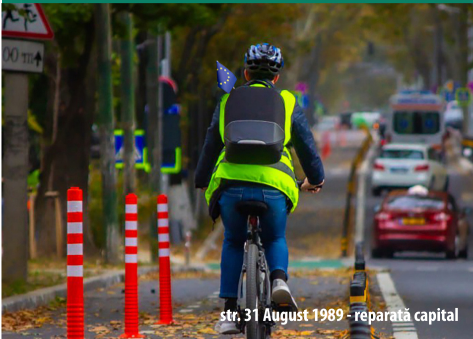
str. 31 August 1989 - reparată capital

Toate acțiunile pozitive realizate în Chișinău și suburbii, cum ar fi: proiectele mari de infrastructură, construcția și reconstrucția de străzi și drumuri, trotuare, subterane reparate și reabilitate, parcuri moderne, grădinițe și școli construite de la zero și extinse, cea mai largă gamă de servicii sociale pentru copii, familii tinere, pensionari și persoane cu nevoi speciale, proiecte sociale și culturale, reprezintă rezultatul muncii unei echipe de profesioniști și susținerii locuitorilor Chișinăului. Mai este mult de lucru - multe proiecte ample se desfășoară în toate sectoarele Chișinăului și în suburbii.