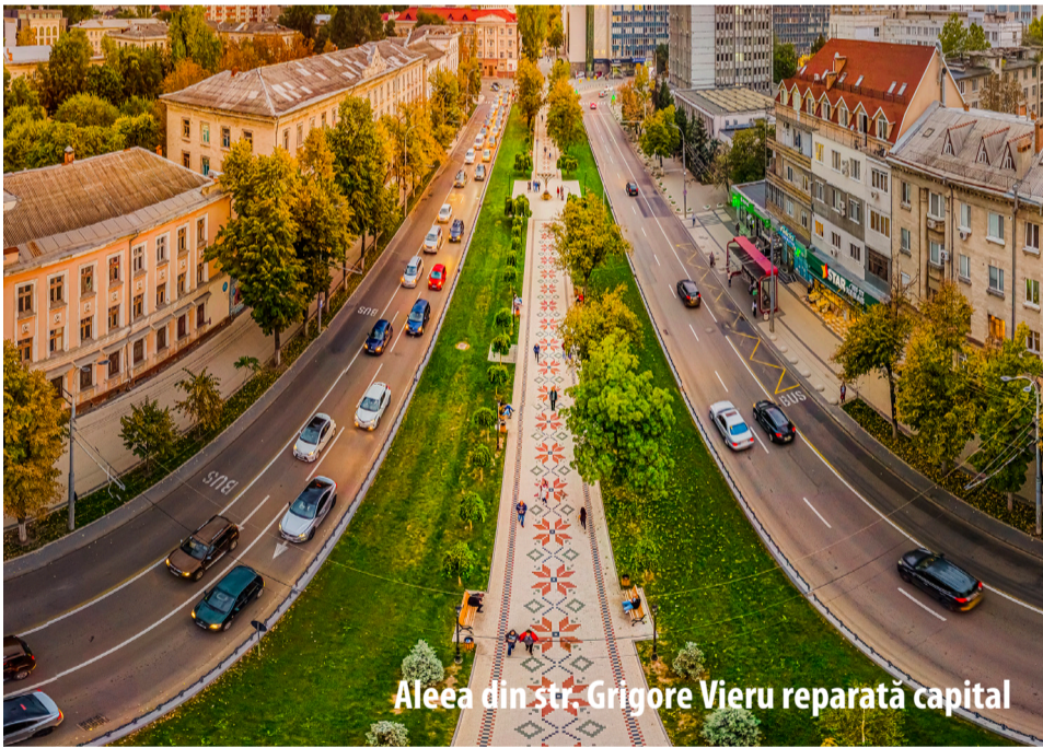
Aleea din str. Grigore Vieru reparată capital