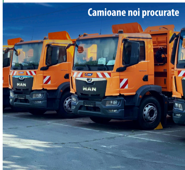
Camioane noi procurate

Proiectul „Deșeuri Solide Chișinău”, finanțat de către Primăria Chișinău și investitorii internaționali.