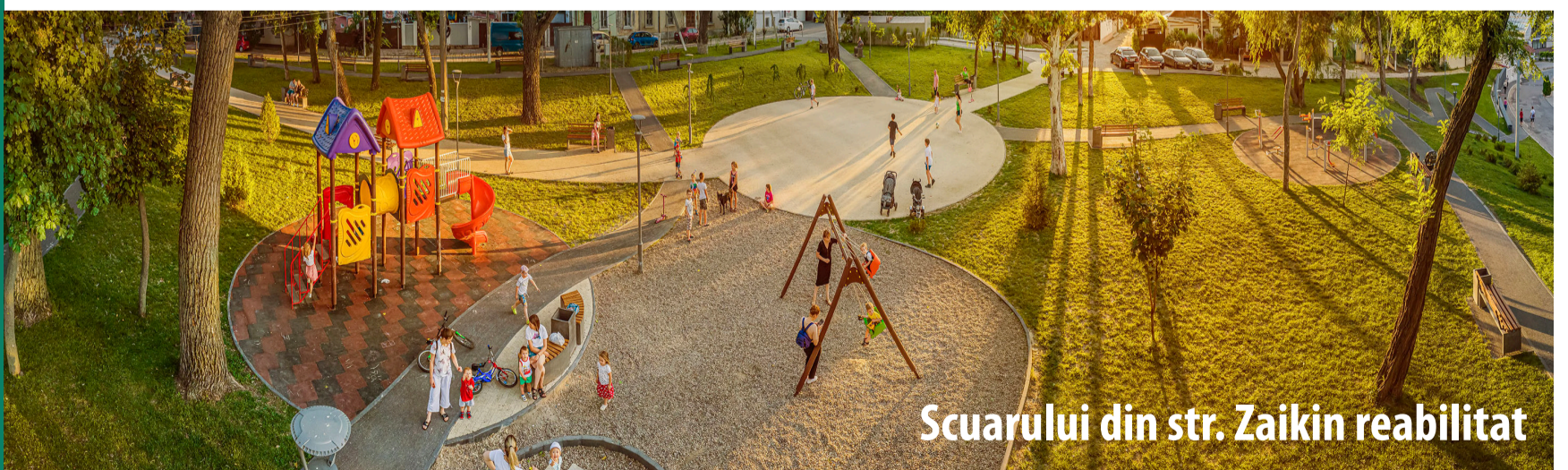
Scurului din str. Zaikin reabilitat