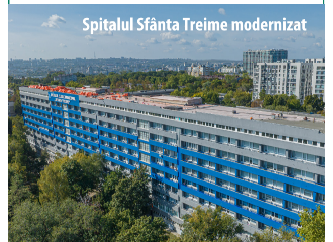
Spitalul Sfânta Treime modernizat

Proiectul „Eficiența energetică și reabilitarea termică a clădirilor din municipiul Chișinău” cu participarea financiară a partenerilor de dezvoltare europeni