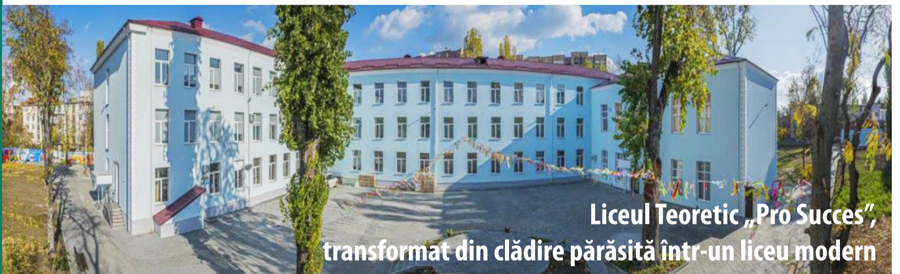
Liceul Teoretic „Pro Succes”, transformat din clădire părăsită într-un liceu modern