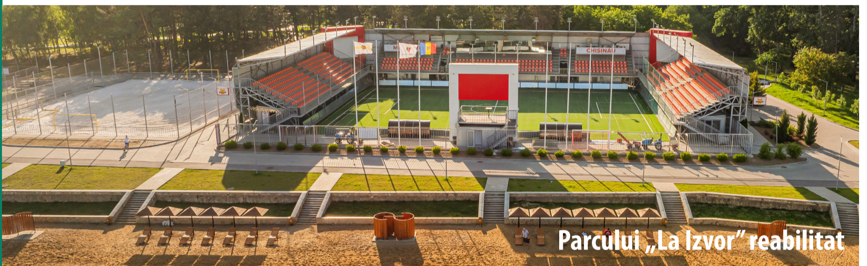
Parcului „La Izvor” reabilitat