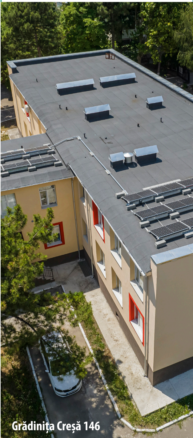
Grădinița Creșă 146

Grădinițe, școli și case de cultură reparate și modernizate în localitățile Republicii Moldova