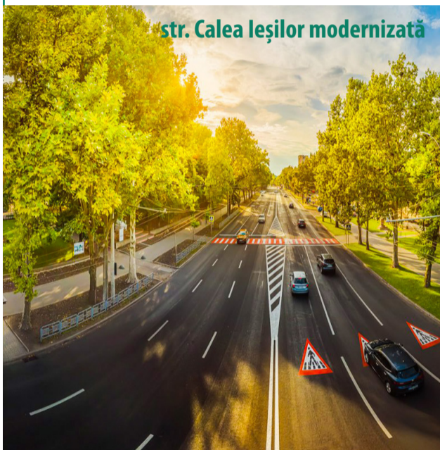
str. Calea leșilor modernizată

Proiectul „Chișinău – Drumuri Urbane”, finanțat de instituții financiare europene