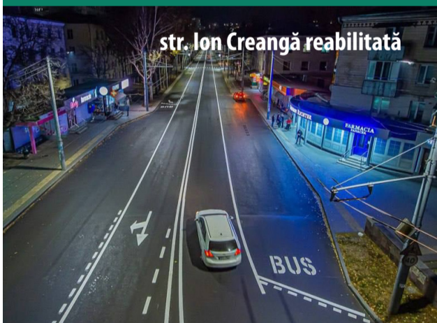
str. Ion Creangă reabilitată

Proiectul „Chișinău – Drumuri Urbane”, finanțat de instituții financiare europene