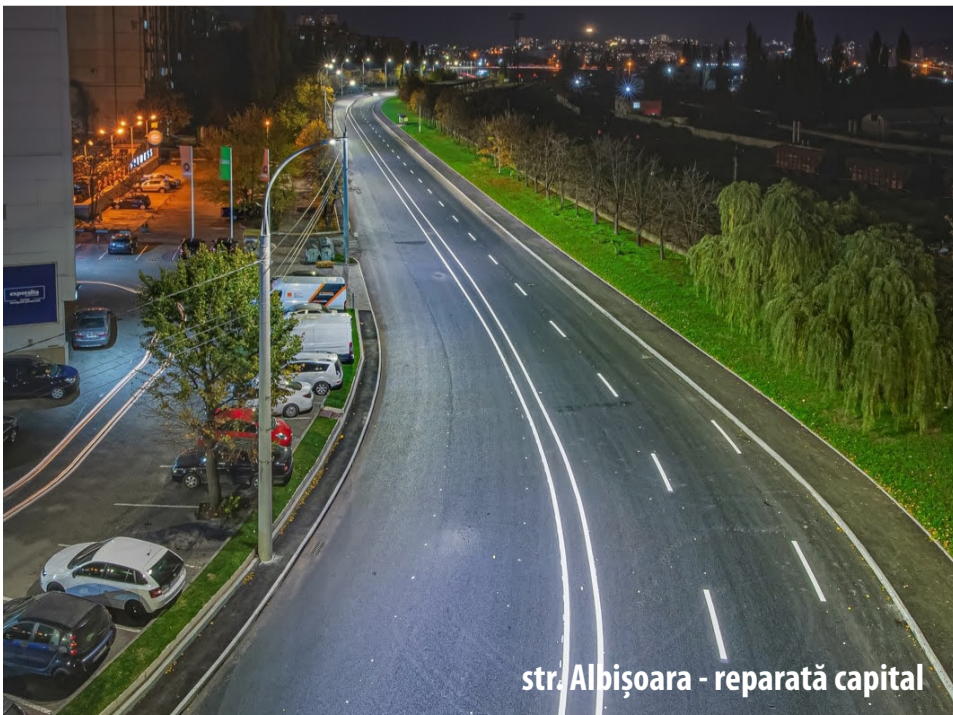
str. Albișoara - reparată capital